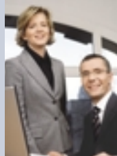
M. Franke/K. Bornberg